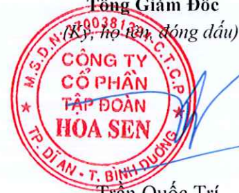
Trần Quốc Trí