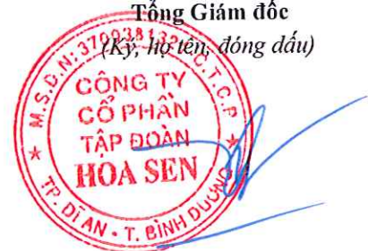
Trần Quốc Trí